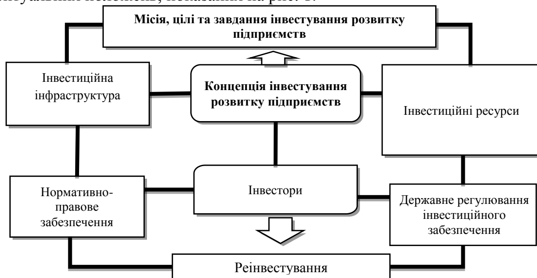
Рис. 1. Концепція інвестування розвитку підприємств

Формування системи інвестування розвитку підприємств вимагає втілення певних концептуальних положень, показаних на рис. 1.