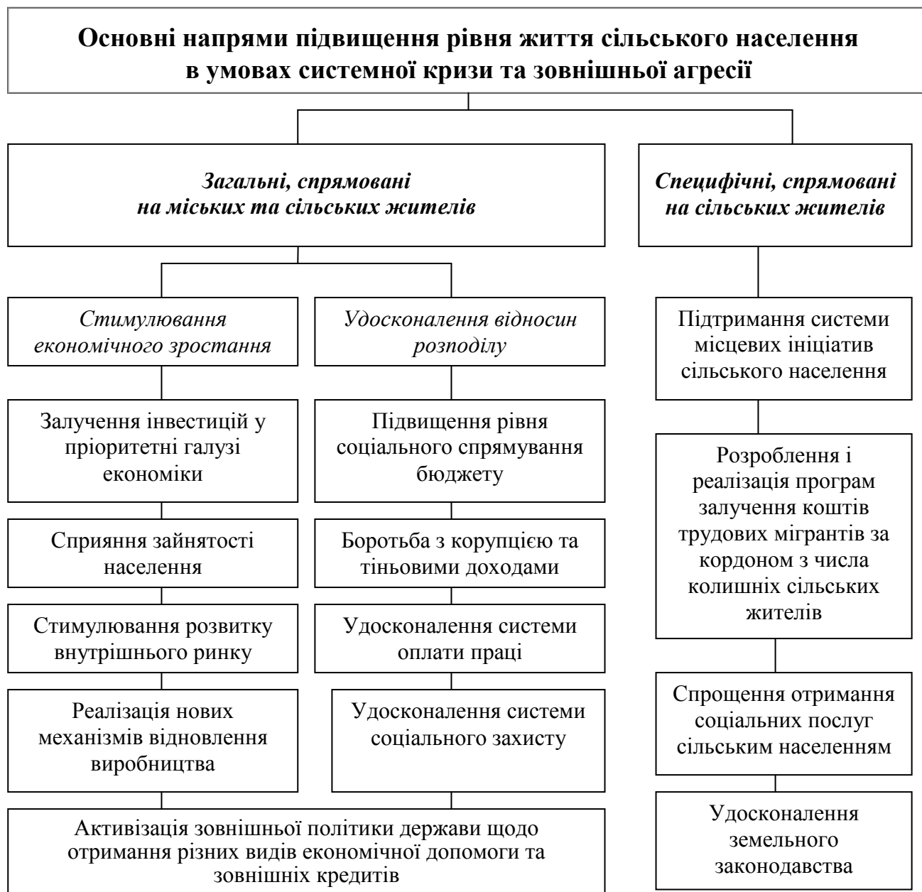
Рис. 2. Основні напрями підвищення рівня життя сільського населення в умовах системної кризи та зовнішньої агресії