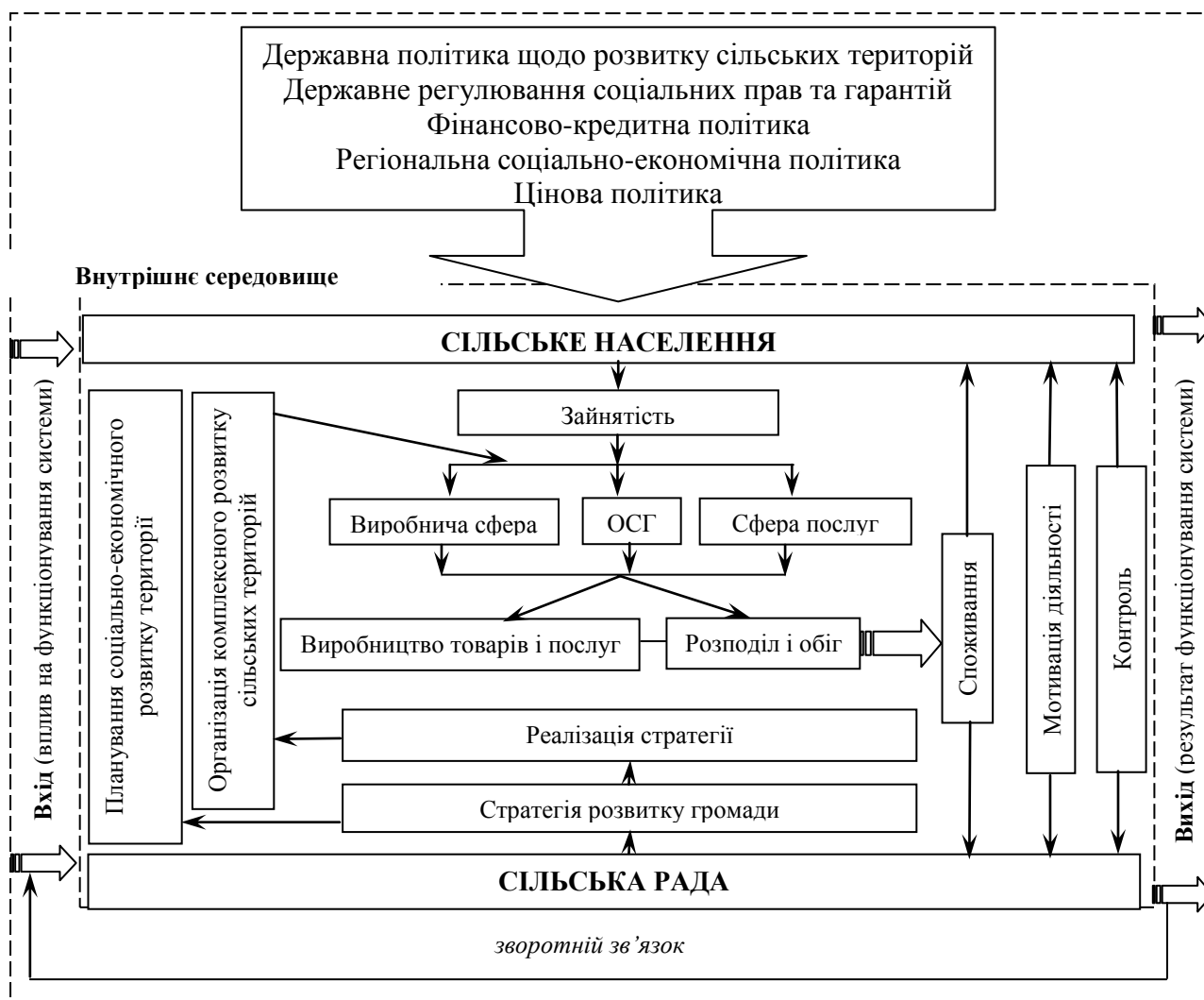
Рис. 1. Організаційно-економічний механізм регулювання рівня життя населення на рівні сільської територіальної громади