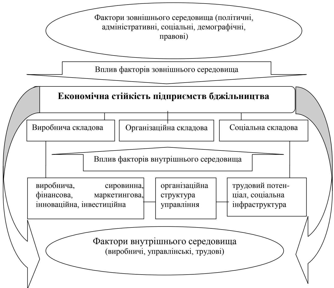
Рис. 1. Фактори формування економічної стійкості підприємств бджільництва

економічну стійкість як сукупність взаємопов'язаних та взаємообумовлених складових, які забезпечують збалансований розвиток підприємства шляхом встановлення оптимальних кількісних співвідношень між елементами системи та формування сталих структурних зв'язків між ними). Другий підхід – ситуаційний (покликаний виявити закономірності формування економічної стійкості в просторі й часі та розробити комплекс управлінських дій щодо забезпечення динамічної рівноваги підприємства у визначений період часу в конкретній економічній ситуації).